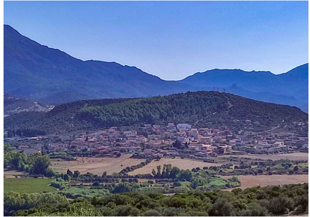
Santadi bista de Pani-Lòriga

Su territòriu mesurat 116 km cuadraus e ddu podeus spartziri in duas partis de mannària prus o mancu uguali. A parti de mesudi ddoi at is montis de su massìciu sulcitanu – cun is puntas prus artas chi funt a giru de 1000 metrus de artaria (Sèbera, Is Caràvius, Is Maxias) – totu acaraxaus de unu padenti mannu: su chi si narat sa " Bosco di Pantaleo " est sa foresta di lìixi prus manna de totu su Mediterraneu. Custu ambienti, chi a tretus mannus est ancora ìnnidu, at permìtiu sa supravivèntzia de animalis rarus che su cerbu sardu, su martzus e s'àchili. Invècias a parti de tramuntana ddoi at montixeddus prus bàscius fatus de arrocas carbonàticas (prenas de grutas, sa prus connota est sa de Su de is Tzuddas) e unu pranu de orìgini alluvionali chi s'est formau gràtzias a is arrius e arrigàngius (su prus mannu est su chi in is mapas est inditau cun su nòmìni de Rio Santadi) chi ndi calant de is montis prus artus.