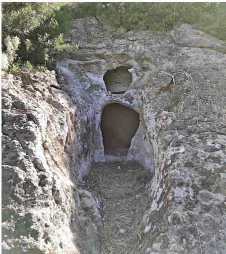
Pani-Lòriga: tumba pùnica

Su territòriu, arricu de àcua e de risorsas naturalis, est adatu a sa laurera e a su pastòriu e duncas est stètiu populau de is tempus prus antigus e est prenu de testimònias archeològicas chi partint de s'edadi neolìtica e arribant fintzas a su tempus de is bizantinus. Unu de is situs archeològicus prus est interessantis est su chi si narat "Area Archeològica di Pani-Lòriga" e pigat su nòmìni de is meris de su medau, ma su nòmìni pretzisu de zona est "Mont'e Sènciu" sichei una borta su logu depiat essi prenu de Artemisia absinthium chi in italianu si narat assenzio . Mont'e Sènciu est de orìgini vulcanica e mancai no arribit mancu a 200 metrus de artària est unu de is logus prus "stratègicus" de totu su Sulcis de Basciu: de sa punta si podit osservai a comenti su pranu, surcau de arrius e arrigàngius, a bellu a bellu nci calat conca su Golfu de Pramas e in est in collegamentu visivu deretu cun s'ìsula de Sant'Antiogu aundi ddoi fiat s'antiga tzitadi de Sulky. Duncas est normali chi giai de s'antigòriu mannu is òminis apant sèmpiri munnicau in custu logu chi at atirau s'interessu de is archeòlogus poita ca permitit de osservai is pillus de tziviltadis diferintis chi in millènius si funt stabilias me inias.