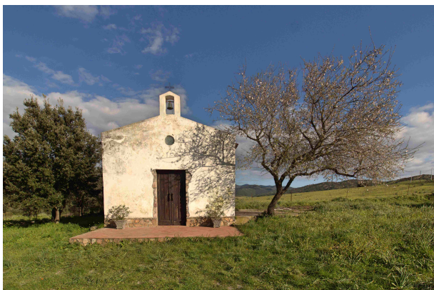
Sa cresie de Santa Maria de Monte Fraca in Barrua