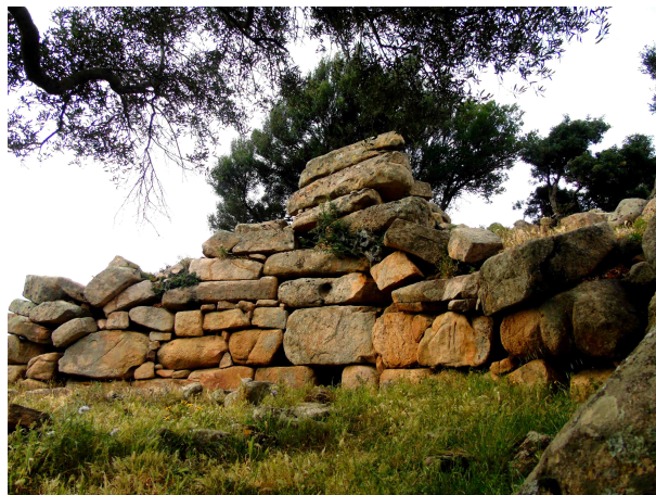
Sa tumba de gigantis de Barrancu Mannu