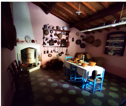
Museu etnogràficu Sa Domu Antiga: sa coxina

In su mentris Santadi s'ghit a si svilupai: 1868 iant fatu su ponti in s'arriu po auniri is duus boddeus; in is annus 80 de s'800 ant fraigau su palàssiu comunali comporendi de s'obispu de Igrèsias su terrenu aundi ddoi fiat su campusantu bèciu. Su palàssiu comunali fiat puru sa sea de su mandamentu provintziali e ospitatu puru sa pretura, e pagu a pustis iant pesau su presoni mandamentali (chi est abarrau obertu fintzas a una trintina de annus a coa). In su mentris s'amministratzioni comunali impegnada a risolvi is problemas mannus nàscius de sa bèndida de su padenti chi iant criau confusioni manna in sa proprietadi fundiaria e in sa progetatzioni de is istradonis cunsortilis chi serbiant a ammelliorai sa comunicatzioni cun Casteddu. A s'acabu de s'800 iant obertu puru su monti granàticu (unu est in mesu de sa bidda aundi imoi ddoi at sa banca) po favoressi su sviluppu de sa laurea. A pustis de sa segunda gherra mundiali s'intrada in crisi de su setori mineràriu, Santadi comenti totu su Sulcis at patiu meda s'emigratzioni ma is cunditionis econòmicas ant mudau in is annus 60: infatis su polu industriali de Portovesme arrinnesiat a assurbiri sa manodopera pèrdia de sa miniera, e in su mentris iant fundau sa Cantina e sa Lateria Sociali po sfrutai sa grandu produtzioni agrìcola.