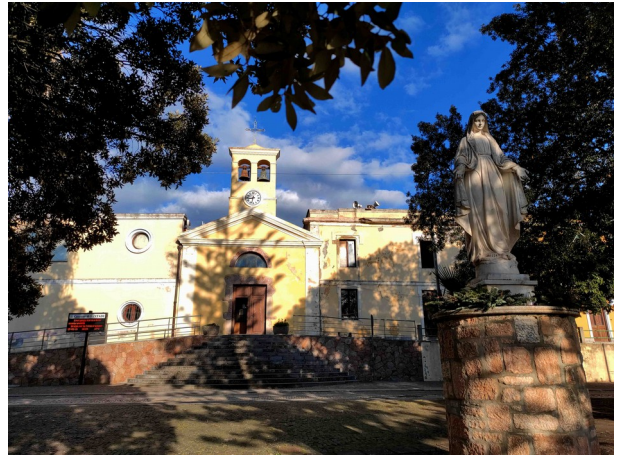
Sa crèsia de Santu Nicolau