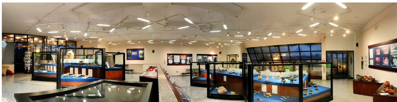
Su Museu Archeològicu de Santadi